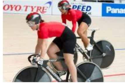
女子チームスプリント (強化 A チーム)