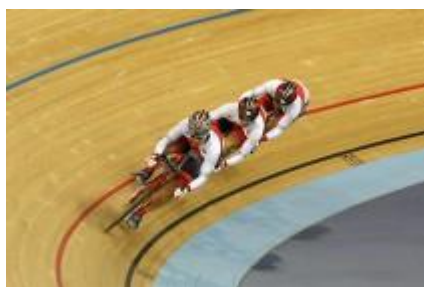
男子チームスプリント 日本チーム