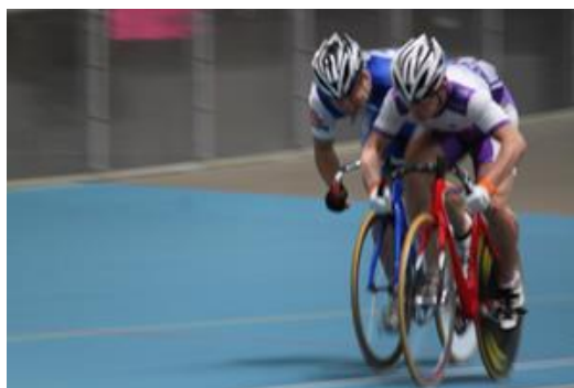
男子スプリント 1/2 決勝