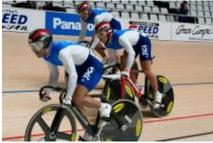
男子チームスプリント (強化チーム)