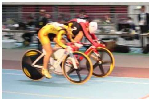
女子ケイリン決勝